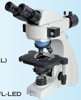
BM-700 CON FL-LED