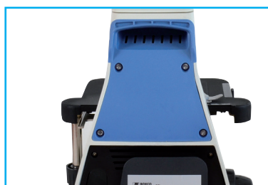
ASA TRASERA / ENROLLADO DEL CABLE DE PODER