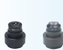
CONDENSADOR DE CAMPO OSCURO SECO Y ACEITE