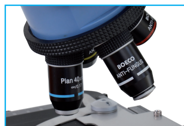
OBJETIVO CON TRATAMIENTO ANTI-HONGOS