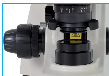
COLECTOR Y CONDENSOR