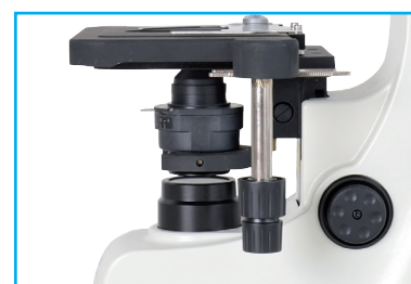
CONTROL DE PLATINA A LA MANO DERECHA